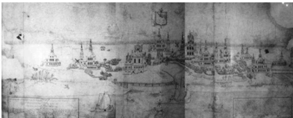
Рис. 1. Перспективный план города Сольвычегодска 1793 г., выполненный А. Чудиновым. Хранится в Сольвычегодском историко-художественном музее

Несмотря на многочисленные изменения и перестройки, в основном из-за пожаров, наиболее ранним является Благовещенский собор (рис. 2), и