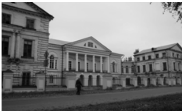
Рис. 6. Дом Пьянковых. XVIII в. Фото автора, 2017 г.