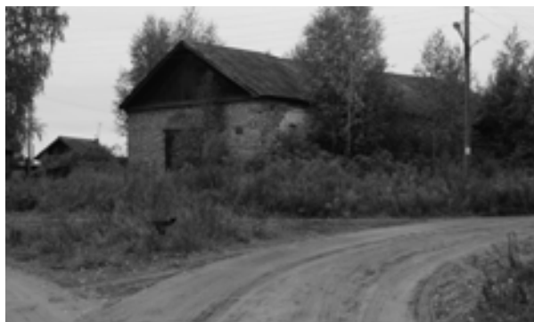
Рис. 5. Владимирская церковь. Фото автора, 2017 г.

Городские усадьбы Сольвычегодска долгое время были деревянными, а застройка часто страдала от пожаров. Каменное усадебное строительство стало распространяться на рубеже XVIII – XIX вв. Первые каменные усадьбы формируют Торговую площадь, что наглядно видно на плане 1819 г. Это городская усадьба Хаминовых, магистрат и богадельня (доходный дом купца Хаминова), дом Пьянковых, дом купца Инкина Н.А. (Боярынцева).