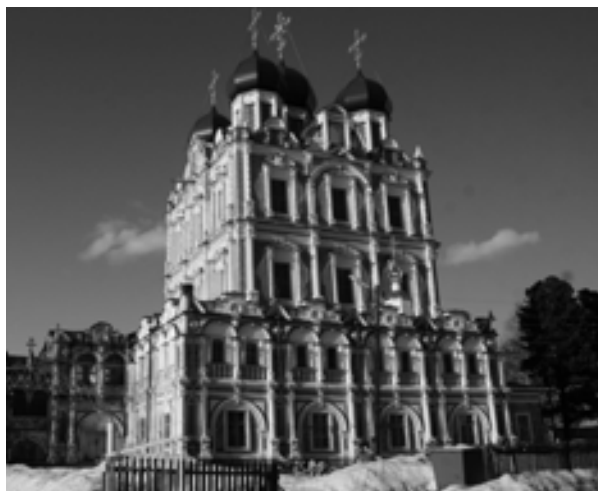
Рис. 3. Введенский собор Введенского монастыря. Фото автора, 2018 г.

Развитие города в это время осуществлялось скорее за счет уплотнения застройки, нежели за счет расширения границ. Таким образом, к последней четверти XVIII в. сложилась ситуация скученности деревянной застройки, в которой любое незначительное возгорание грозило перерасти в пожар. В том числе и эту проблему должен был решить генеральный план уездного города Сольвычегодска, выполненный по ре-