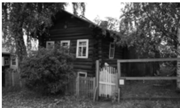
Рис. 9. Улица Пролетарская, д. 13. Фото автора, 2017 г.