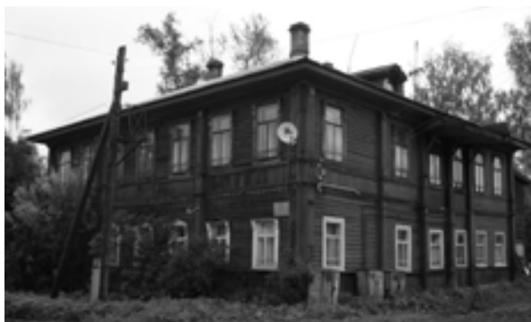
Рис. 8. Дом Ионых. XIX в. Фото автора, 2017 г.

Среди городской застройки выделяется крупная усадьба – дом Пьянковых, строительство комплекса которого велось с XVIII в. по 1860 г. (рис. 6). Усадьба решена в стилистике позднего классицизма.