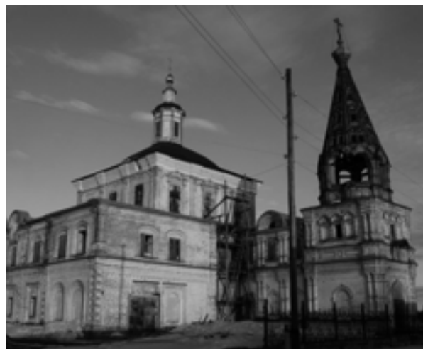
Рис. 4. Спасообыденная церковь. 2018 г.