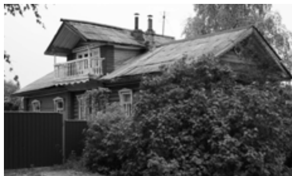
Рис. 10. Улица Пролетарская, д. 45. Фото автора, 2017 г.

Также распространены типы домов-пятистенков в 5-6 окон с мезонином, с вальмовой кровлей, с оформлением фронтона балконом. Характерная особенность большинства жилых построек – высокий подклет. Один из наиболее интересных в части декоративного оформления домов представлен на рис. 10.