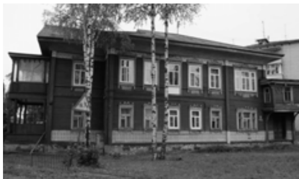
Рис. 7. Дом жилой купца И.В. Хаминова. XIX в. Фото автора, 2017 г.